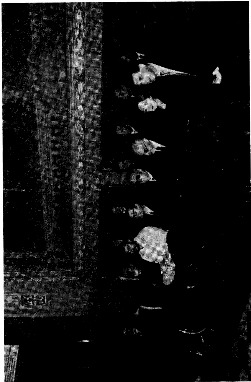
Članovi diplomatskog zbora i dno sudionika skupa na svečanoj misi u crkvi sv. Jeronima, 29. XI. 1998.