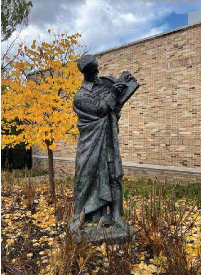
The statue of Marko Marulić by Ivan Meštrović (Campus of Notre Dame University, South Bend, Indiana)