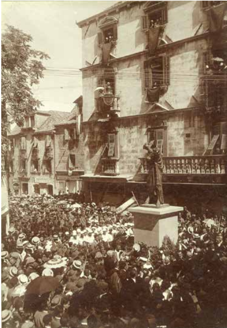
Otkrivanje spomenika Maruliću u Splitu (rad Ivana Meštrovića, 1925)